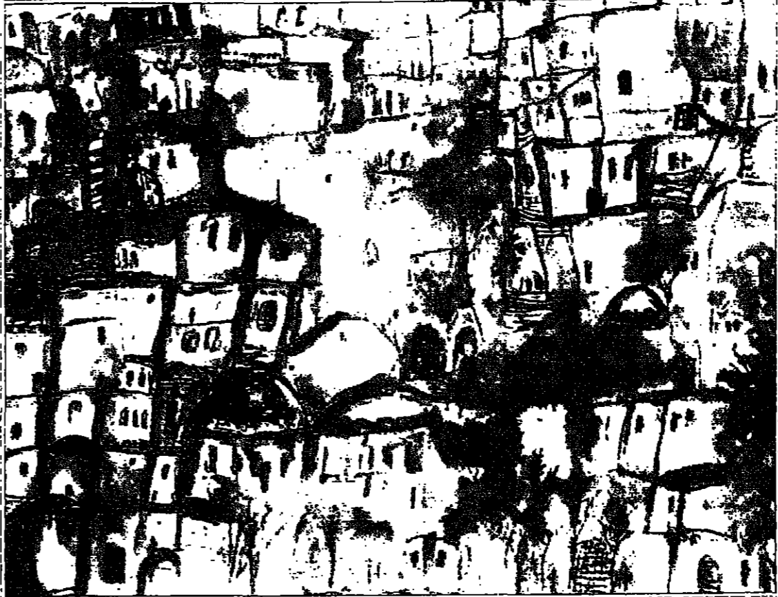
من أعمال الفنانة